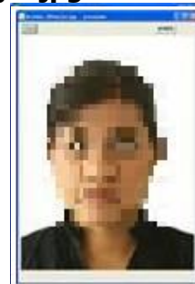
Foto UVmajul.jpg de 480 x 640 píxeles

Se obtendrá un nuevo archivo con la foto reducida cuyo nombre será el del archivo procesado, precedido de las letras UV. El nuevo archivo estará en el directorio del archivo original.