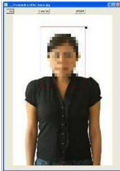
Foto majul.jpg de 2848 x 4272 píxeles

Para agrandar el cuadro si así se desea, se debe situar el cursor sobre el cuadro negro pequeño, dar clic sin soltar el botón izquierdo y arrastrar para agrandarlo al tamaño deseado.